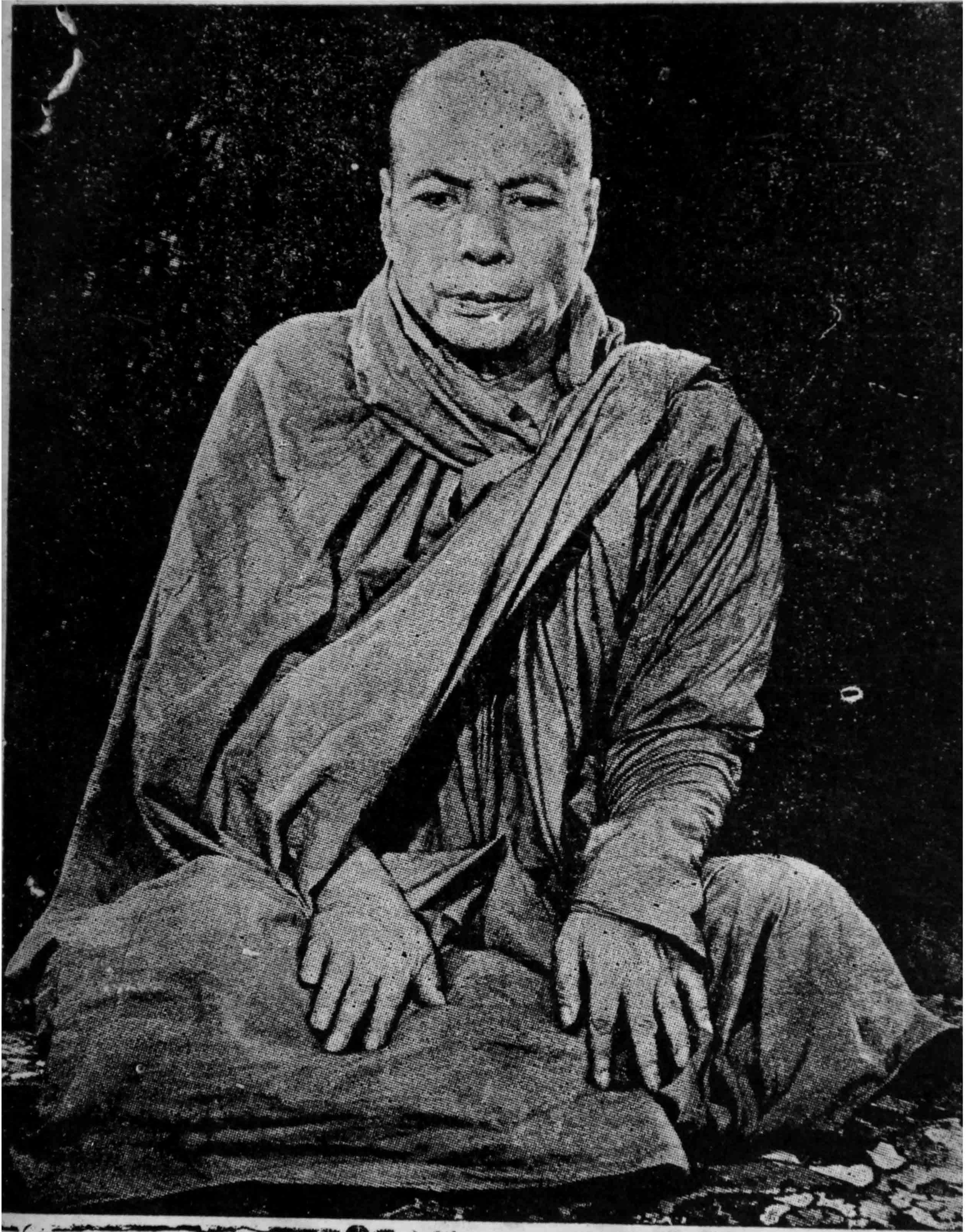
“အဂ္ဂမဟာပဏ္ဍိတ” ကျေးဇူးရှင်-မိုးကုတ်, ဆရာတော်ဘုရားကြီး