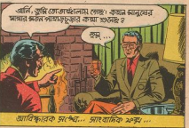
আবিষ্কারক সচিব... সার্বভাসিক মঞ্চ...