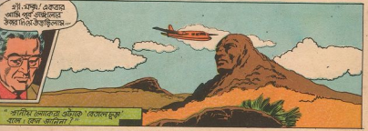
"সানিউ লোকের ওটাক 'বিসাল লুজ' বলে : কেন জানিনা?"