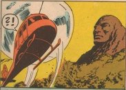
"আবার... সেই ছোড়াটা..."