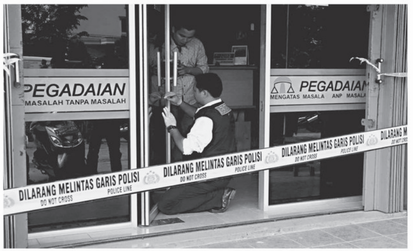
PERAMPOKAN - Petugas polisi sedang melakukan pengambilan sidik jari di kantor Unit Pelayanan Cabang Kurnia Djaya Alam Jalan Kurnia Abulyatma, Senin (26/9). Perampok berhasil membawa kabur perhiasan yang berada didalam brankas.

perampokan. Yang pertama terjadi di Kantor Pegadaian unit Dapur 12, di Ruko Kavling Pelopor Blok A Nomor 282, Sagulung, yang terjadi pada 17 Mei lalu. Akibat peristiwa naas itu diperkirakan perhiasan milik nasabah senilai Rp 1,3 miliar dan uang tunai sebesar Rp 87 juta raih digasak maling, hingga kini polisi masih mencari pelaku. Di antara perhiasan yang hilang tersebut ada juga barang pusaka milik warga. Sebelumnya, dalam penelusuran kepolisian yang melakukan pengejaran terhadap para perampok, KCP Pegadaian Sagulung ini polisi menangkap telah mengantongi enam nama. Keenam nama ini diduga kuat sebagai pelaku dari perampokan yang membekal berakus senilai Rp 1,2 miliar. (elc)