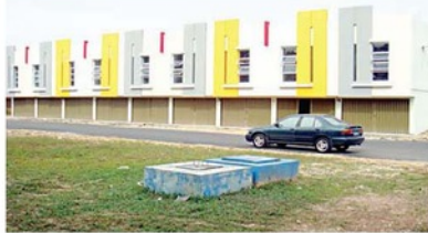
Town House Puri Loka

Marketing Beverly Extension Batam Centre 0778-7070090, 7283537, 7076463 Town House Puri Loka Telp 0778-7212448, 705 6726, 723 3436.