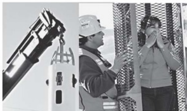
KAPSUL PENYELAMAT - Cile menyiapkan sebuah kapsul seberat 420 kg untuk membantu penyelamat 33 penambang yang terjebak di bawah tanah sedalam 701 meter sejak 5 Agustus lalu. Kapsul diharapkan bisa membawa satu per satu penambang ke permukaan setelah proses pengeboran selesai.