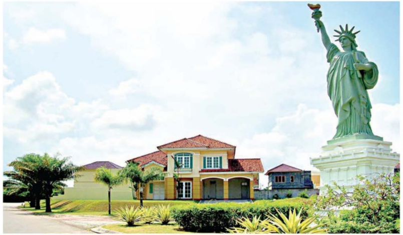
Perumahan Beverly Batam Centre