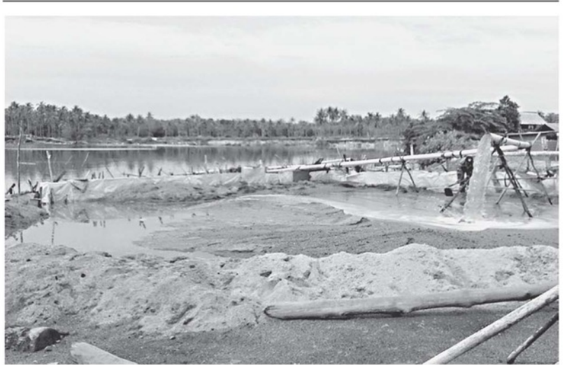
KOLAM PASIR - Aktivitas penggalan pasir darat di kawasan Nongsa membuat kolam-kolam besar. Foto diambil beberapa waktu lalu.

“Intinya itu, kami ingin memberikan pelayanan yang maksimal demi memudahkan nasabah dalam semua transaksi di Bank Riau ini termasuk Bank Riau Syariah,” pungkasnya. (tik)