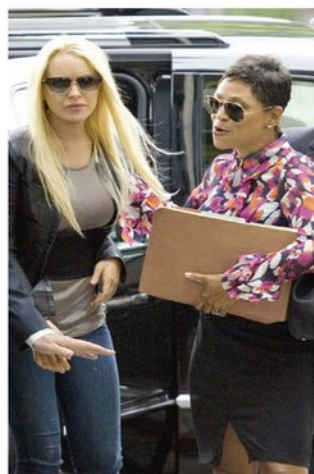
CATATAN BURUK - Lindsay Lohan saat baru tiba di gedung Pengadilan Beverly Hills, California, Senin lalu.

"Menyesal sekali, nyatanya aku sudah gagal dalam