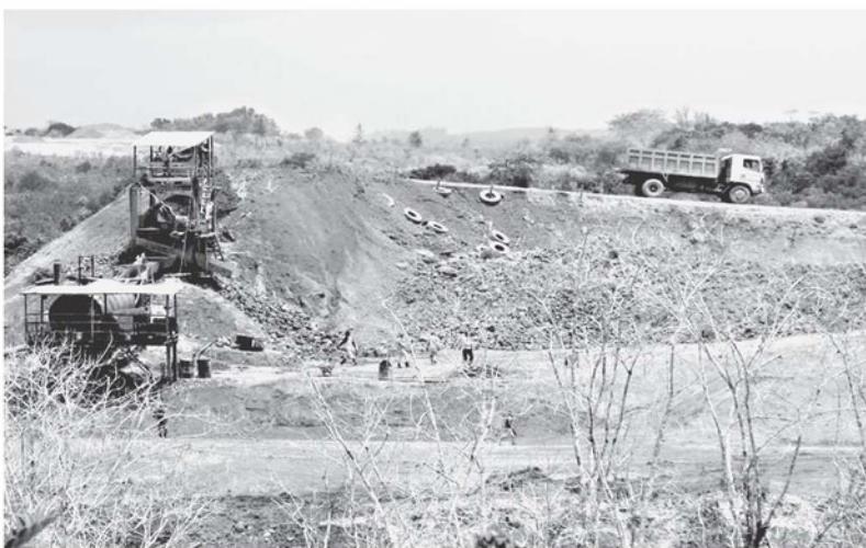
GERANG - Banyak wilayah di Kabupaten Bintan menjadi lahan tambang dan kini suasananya telah menjadi gersang. Seperti halnya yang ada dengan tambang bauksit di Tembeling, Kecamatan Teluk Bintan ini, pepohonan tampak mengering di antara kesuburan truk-truk pengangkut.

"Warga masih bisa menahan dan berharap itikad baik dari perusahaan. Jika memang tidak ada, warga akan