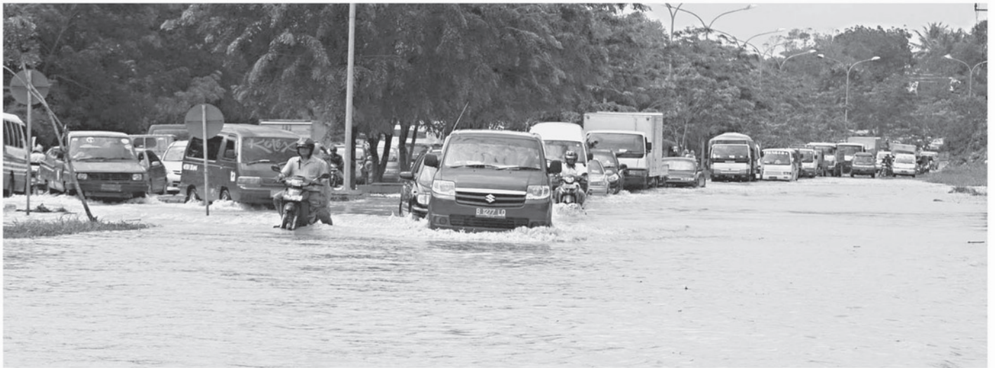
BANJIR - Tingginya curah hujan disertai belum baiknya saluran mengakibatkan sejumlah kawasan di Batam rawan banjir. Seperti ruas Jalan Raya Tembesi yang tergenang banjir ratusan meter awal tahun lalu.