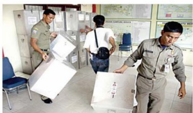
SIAPKAN LOGISTIK - Kesibukan para petugas menyiapkan logistik pemilihan umum menjadi pekerjaan rutin menjelang pemilu dijangkitkan, termasuk untuk Pilwako Batam 2011.