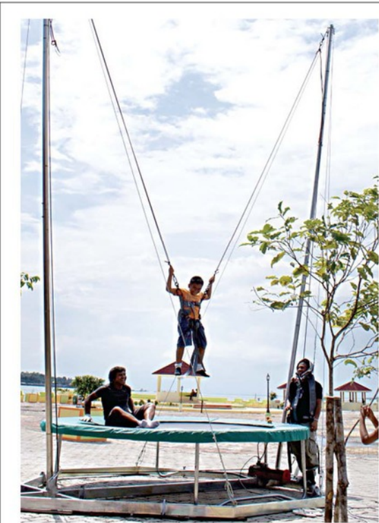
BUNGEE TRAMPOLIN - Seorang anak sedang bermain bungee trampoline di Anjung Cahaya, Minggu (26/9). Hingga Oktober, pengenal akan memberikan harga spesial yakni Rp 10 ribu per lima menit.