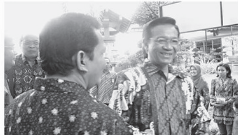
SILATURRAHMI - Raja dan Gubernur Yogyakarta, Sri Sultan Hamengkubuwono X, menghadiri silaturrehmi Kagama di kediaman Wakil Gubernur Kepri, H.H. Soerya Respatono di Taman Duta Mas, Batam Centre, Minggu (26/9).

syarakat juga bisa menilai," kata Sultan. Terkait kerjasama antar Yogyakarta dan Kepri, Sultan mengaku akan membicarakan lebih lanjut karena menurutnya, Batam memiliki potensi yang besar dalam destinasi wisata. Apalagi bila Batam bisa memanfaatkan posisinya yang sangat strategis. "Nanti akan kami bicarakan lebih lanjut, karena saya sendiri belum mengetahui potensi apa yang bisa untuk bekerjasama nantinya. Tentu gubernur dan wakil gubernur akan saling berbagi pengalaman," paparnya. (man)