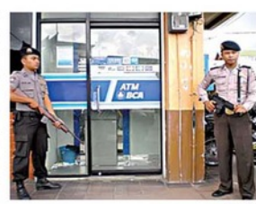
JAGA KETAT -Dua orang personel kepolisian menggunakan senjata laras panjang saat menjaga ATM di Padang, Sumatera Barat, Minggu (26/9).