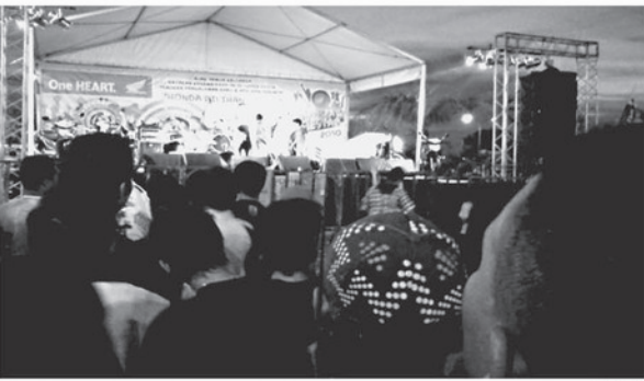
ANTUSIAS - Sejumlah penonton antusias melihat penampilan Angkasa Band di Mall TOP 100 Batam, Minggu (26/9).