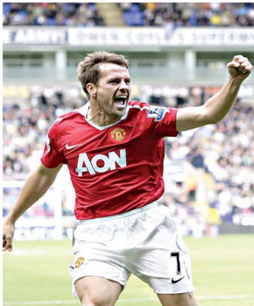
GOL KE-200 - Michael Owen melakukan selebrasi usai mencetak gol saat menyamakan kedudukan 2-2 atas Bolton Wanderers, dalam laga Minggu (26/9) malam WIB. Gol itu bagi Owen adalah yang ke-200 selama merumput di Liga Inggris.

■ Masih Diami Rumah Dinas ■ Sudah Kembalikan Mobil Dinas