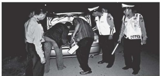
PERIKSA MOBIL - Anggota Polres Bintan saat melakukan pemeriksaan mobil untuk mencari senjata api di lokasi Ppantai Sakera, Sabtu (25/9) dini hari.