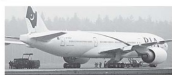
ANCAMAN BOM - Polisi khusus Swedia (SWAT) melakukan pengamanannya begitu pesawat mendarat setelah mendapat informasi ada penumpang membawa bom.

Informasi ancaman bom sampai saat pesawat yang dilatir, perjalanan dari Kanada ke Pakistan sedang berada di wilayah udara Eropa. Pesawat dengan 275 penumpang itu pun mendarat darurat di Swedia. Lelaki berusia 25 tahun yang merupakan penumpang pesawat tersebut ditangkap polisi Stockholm tidak lama setelah pesawat mendarat, dengan tuduhan berencana untuk menyabotase pesawat. Polisi Swedia, Janne Hedlund mengatakan bahwa seorang wanita menghubungi polisi Kanada dan mengatakan bahwa ada seorang pria yang memiliki bahan peledak berada di pesawat tersebut. "Kami belum tahu siapa penumpang ini," katanya seperti dilansir The Sun . Atas informasi tersebut, kru pesawat tidak mau mengambil risiko, dan mengambil keputusan untuk melakukan pendaratan darurat.