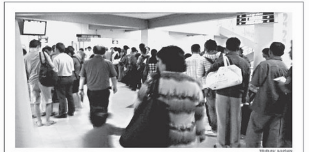
WISATAWAN - Kepadaan tampak di pelabuhan Ferry internasional Batam Centre, Minggu (25/9). Puluhan wisatawan asing dari Singapura dan Malaysia yang berlibur ke Batam tampak memadai pintu keberangkatan untuk kembali ke negaranya setelah menjajal libur akhir pekan di Batam. Hal serupa juga biasa terlihat ketika akan memasuki liburan global. Para Wisatawan asal Singapura dan Malaysia ini seperti cenderung mengincar Batam sebagai tempat liburan satu atau dua hari, kotimbang menetap di negaranya.