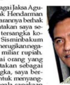
Yusril Izza Mahendra

Dalam surat pernyataan sikapnya, Yusril juga memaafkan Hendarman. "Saya memaafkan beliau. Apa yang terjadi sesungguhnya adalah pertarungan pribadi, bukan pertarungan pribadi."