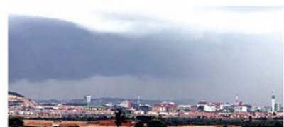
MENDUNG - Awan gelap menyelimuti langit kawasan Batam Centre, beberapa waktu lalu. Selain mencurahkan hujan, awan itu juga bisa menghasilkan petir dan angin puting beliung.