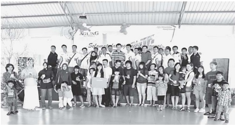
SENSATION - Para pemilik Toyota Yaris berpose bersama usai penarikan hadiah Yaris Sensation dan hadiah beralang di Barelang Seafood Restaurant, Sabtu (25/9). Kegiatan kekeluargaan yang digelar oleh Agung Auto Mall ini diawali dengan korvoi bersama menuju lokasi.