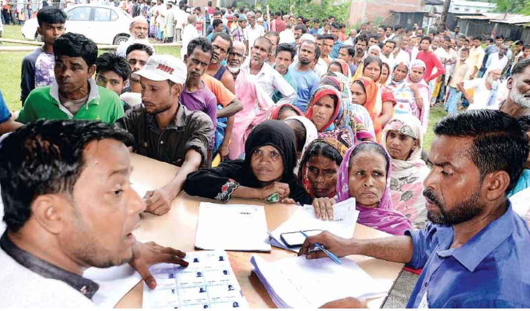
રવિવારે રાતે અંદાજે 10 વાગ્યે NRC ડેટા જાહેર થયો. ત્યાર બાદ જે લોકોનાં નામ યાદીમાં નહોતાં તે રાતે જ એનઆરસી સેન્ટર પર પહોંચી ગયા.