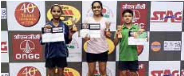
ભાવનગર | ૩૦ જુલાઈ

તમે નહીં માનો, પણ આપણા અમદાવાદના પેલા બે ટપોરીઓ પાસે આડેધડ થતા પાર્કિંગનું જોરદાર સોલ્યુશન છે! લો સાંભળો... ■ ■ ■ ‘ઉસ્તાદ મેં ક્યા બોલ રૈલા હું, આપણે અમદાવાદ મેં બિચારી પુલીસ આડેધડ પાર્કિંગ રુકવાણે કે લિયે કિતી મેનત કરતી હે?’ ‘તો? તું કાયકુ ઊંચાનીચા હોતા હે? તેરે પાસ તો ખખડેલી સ્કુટી બી નંઈ હેગી.’ ‘વો બાત અલ્લગ હૈ, મગર સુનો તો સઈ?’ ‘બોલ’ ‘યાદ હે? ૧૯૯૩ મેં જબ મુંબઈ કી ટ્રેનો મેં બોમ બ્લાસ્ટ હુવે થે?’ ‘હાં... આતંકવાદીઓને ટ્રેન મેં સામાન રખણે કી જાલી પે થેલી મેં બોમ ભરકે રખ ડાલે થે.’ ‘હાં, તબી ઉસ ટાઈમ પુલીસને ક્યા કિયા થા?’ ‘ક્યા’ ‘ટ્રેન ડબ્બે મેં સી સામાન રખણે કી જાલિયાં જ નિકાલ ડાલી થી!’ ‘તો?’ ‘તો ક્યા? ઉસ કે બાદ મુંબઈ કી ટ્રેનો મેં કબી બોમ-બ્લાસ્ટ હુવે?’ ‘હાં... વો તો હે.’